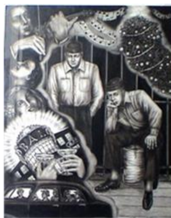
Ilustración 1. Dibujos elaborados a lápiz por Enrico Sampietro